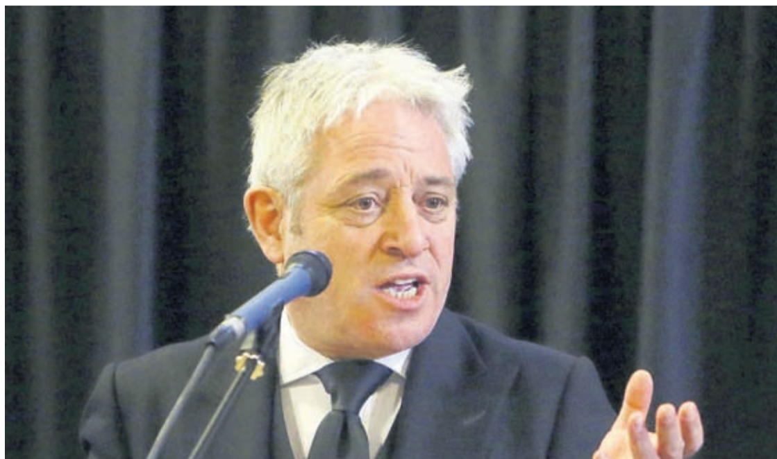
LONDON (AP) – Prome minister, Theresa May tabata preparando ayera pa pidi Union Europeo pa un prolongacion di siki- era algun luna pa Brexit,

despues cu e vocero di parlamento a bisa cu e no por sigui pidi legislacion pa vota riba e mesun acuerdo cu ya nan a rechazos biaha.